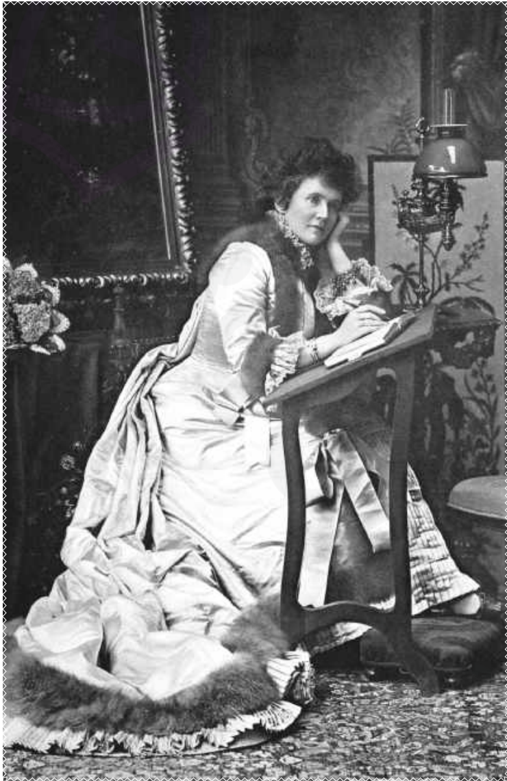
Regina Elisabeta (cãtre 1881)

foto Franz Mandy, imprimatã de Fr. Bruckmann, M¼nchen (colecþia G.B.-P., Paris)